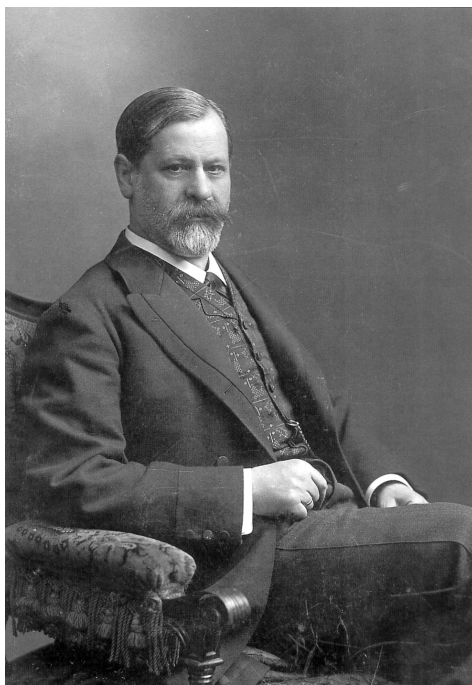
Sigmund Freud, 1906