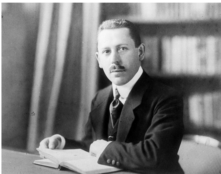
Karl Abraham, 1912